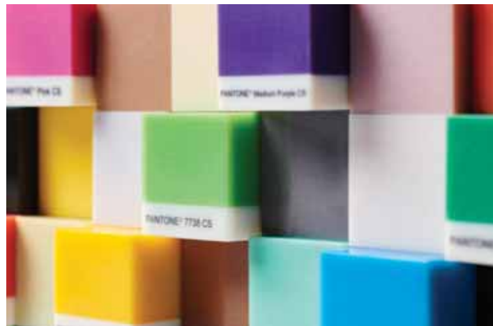
Blocchi di colore Pantone